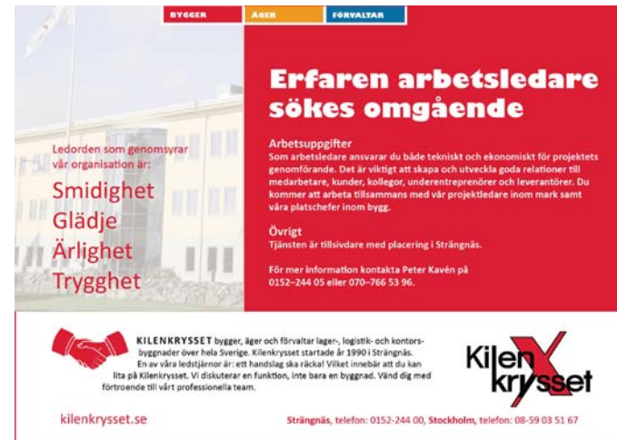
Platsannons A5 i InDesign