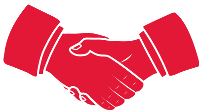
Rött handslag på vit bakgrund.

Handslaget symboliserar Kilenkryssets motto: Ett handslag ska räcka. Den används i kommunikationen för att signalera detta på ett tydligt sätt. Symbolen kan kompletteras med en text som förtydligar vilka Kilenkrysset är och vad vi gör.