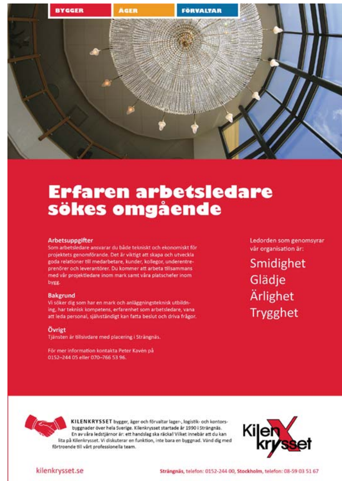
Platsannons A4 i InDesign