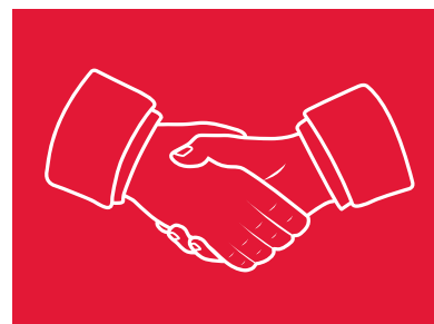
Rött handslag på färgad bakgrund.