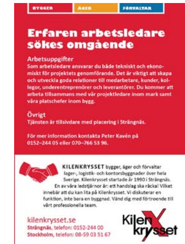
Platsannons A6 i InDesign