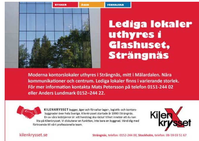
Kontorsannons A5 i InDesign